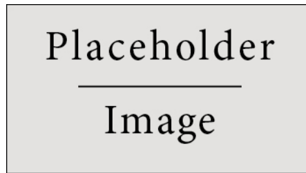
Figure 1: An example of simple figure.