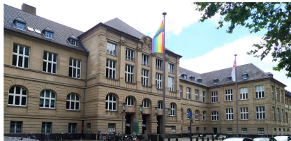
Figure: TH Köln Claudiusstraße 1.