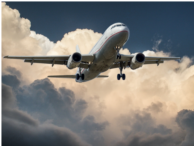
Figure 1.1: AEROPLANE

Nam dui ligula, fringilla a, euismod sodales, sollicitudin vel, wisi. Morbi auctor lorem non justo. Nam lacus libero, pretium at, lobortis vitae, ultricies et, tellus. Donec aliquet, tortor sed accumsan bibendum, erat ligula aliquet magna, vitae ornare odio metus a mi. Morbi ac orci et nisl hendrerit mollis. Suspendisse ut massa. Cras nec ante. Pellentesque a nulla. Cum sociis natoque penatibus et magnis dis parturient montes, nascetur ridiculus mus. Aliquam tincidunt urna. Nulla ullamcorper vestibulum turpis. Pellentesque cursus luctus mauris. [1]