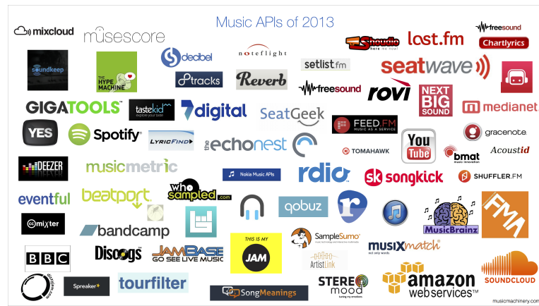
Figura 9: APIs de música em 2013

GET, POST, e DELETE. Em particular, estes serviços podem integrar-se facilmente em diversas aplicações, incluindo as APIs de música.